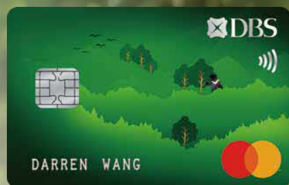
星展商務 eco 卡